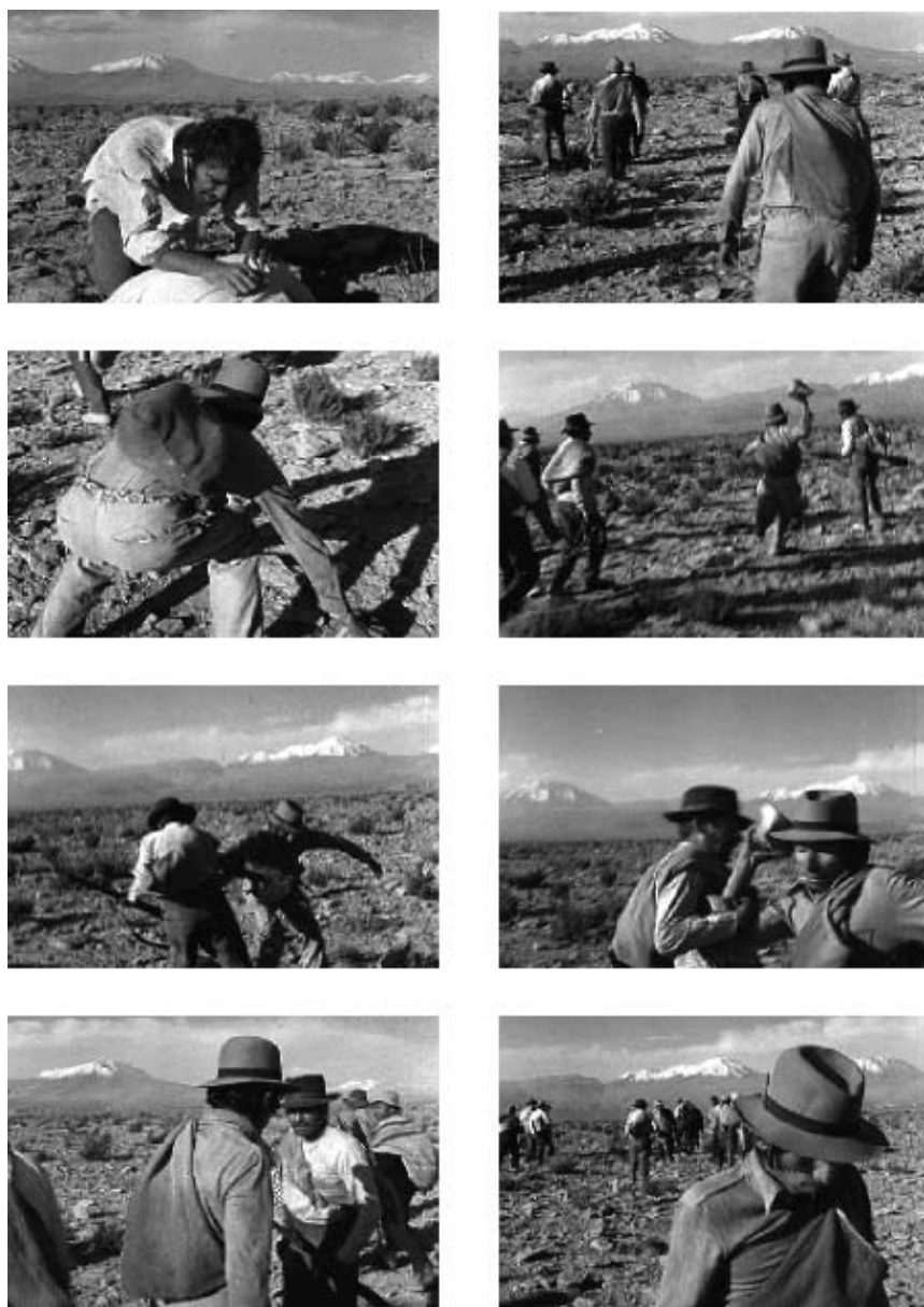
Figura 1. Escena que sanciona negativamente la justicia individual.

fuera propiedad de la comunidad, la caracterología utópica de lo social –signo clave de la construcción dramática– quedaría cancelada.