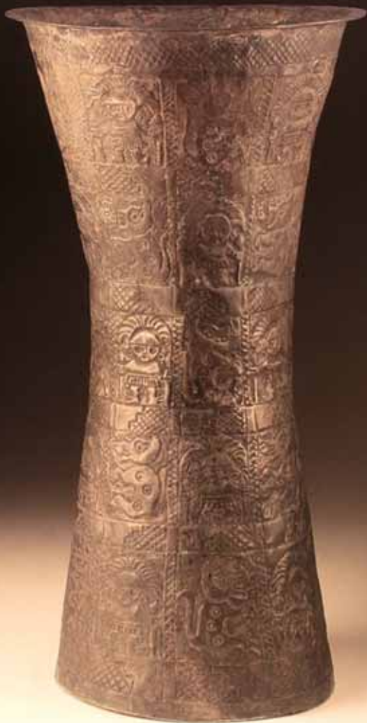
Vaso de plata repujado Chimú 1100-1470 d.C.