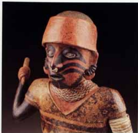
Figura masculina (detalle) Nayawit 100 a.C. - 300 d.C.