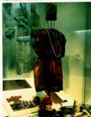
Vitrina Período Formativo, de la exposición de 1985

Suponemos que no llevaba camisa por la información funeraria, coincidente con una tradición costera, atinada en un clima amable y cálido, que no requiere de mayor abrigo.