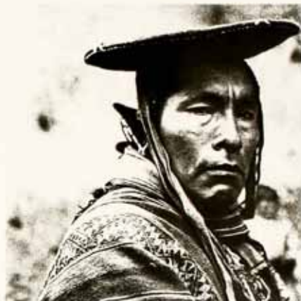
Rostro de un quechua.