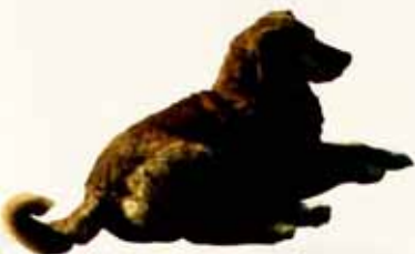
La mascota del Museo de Azapa.

El perro es una mascota que tenían en el Museo San Miguel de Azapa, donde están depositados todos estos objetos. Es semejante a aquellos encontrados en tumbas prehispánicas como atrendas.