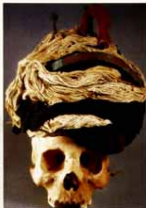
Cráneo con complejo turbante de lana y objetos de metal. fase Taldas del Morro, Museo San Miguel de Azapa.

Es curioso ver a otros a través de sus muertos.