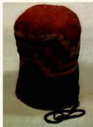
Gorra Jara. fase Alto Ramírez, sitio Az 40, Museo San Miguel de Azapa.