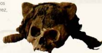
Cráneo con sombrero de lana y peinado con lana, fase Alto Ramirez, Museo San Miguel de Azapa