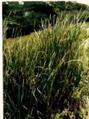
Pastizales, Valle de Azapa