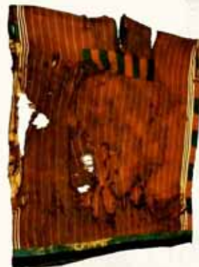
Camisa fase Alto Ramirez, Museo San Miguel de Azapa