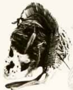
Cráneo con adorno de calva, madera y fibras, fase El Laucho, Museo San Miguel de Azapa

A la derecha están dos individuos que vienen del valle, quizá a intercambiar valiosos collares de cuentas de piedra por objetos marítimos. La reconstrucción de sus vestimentas, gorros y peinados está basada en hallazgos diferentes de ofertarios funerarios de la fase Alto Ramirez, que fueron arbitrariamente agrupados para ataviar a los personajes.