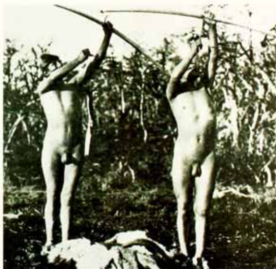
Sekoum despojados de su capa para cazar (foto M. Gusiado 1989 [1937])