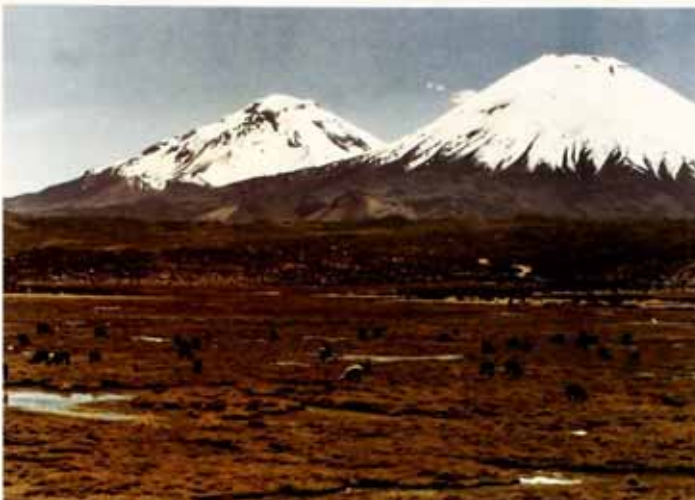
Lago Chungará Altiplano de Altiplano