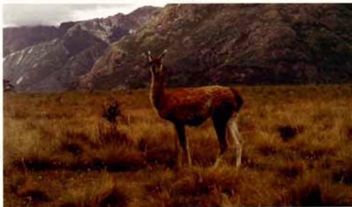
Guanaco ( Lama guanicoe )