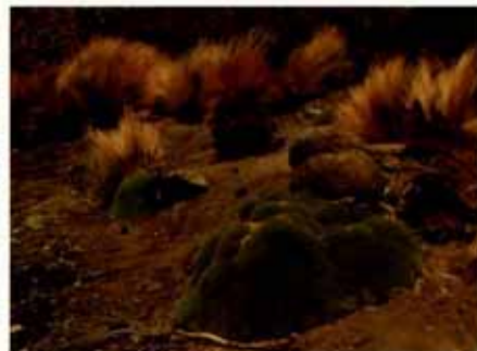
Carota ( Azorella compacta ) Flora Altiplánica