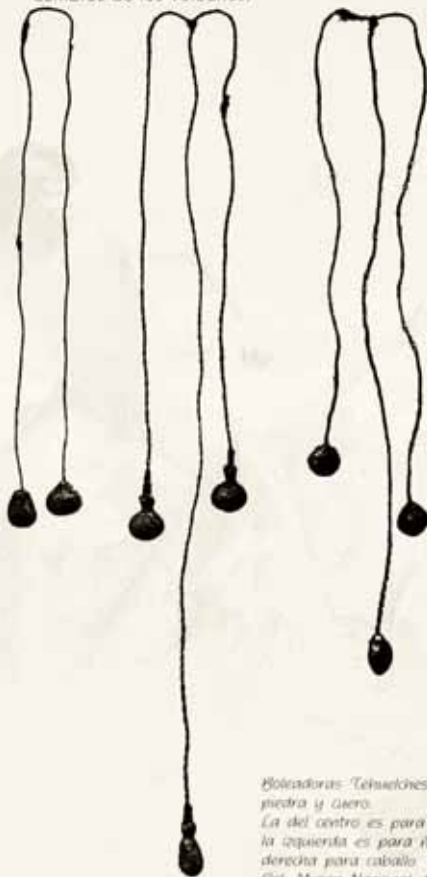
Boleadoras Tehuelches: piedra y cuero. La del centro es para cazar guanacos, la izquierda es para ranas y la derecha para caballo. Del Museo Nacional de Historia Natural, New York.

El paisaje es una llanura altoandina de tipo altiplánico. Un paisaje tan plano que sólo las piedras cubiertas con cojines de llareta permiten esconderse para acechar las manadas de guanacos que pastan en los pajonales. A lo lejos, las nevadas cumbres de los volcanes.